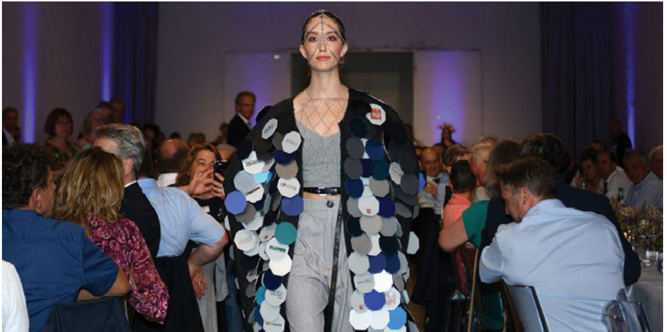
Rückblick auf das sensationelle 60. Jubiläum des VOA

geplant. Zudem stellte der VOA seinen Mitgliedern zahlreiche Informationen wie die Handlungshilfe „Möglichkeiten der Energieeinsparung“ und viele weitere praxisorientierte Tipps zur Verfügung und ermöglicht intensive, fachliche Gespräche der Mitglieder untereinander.