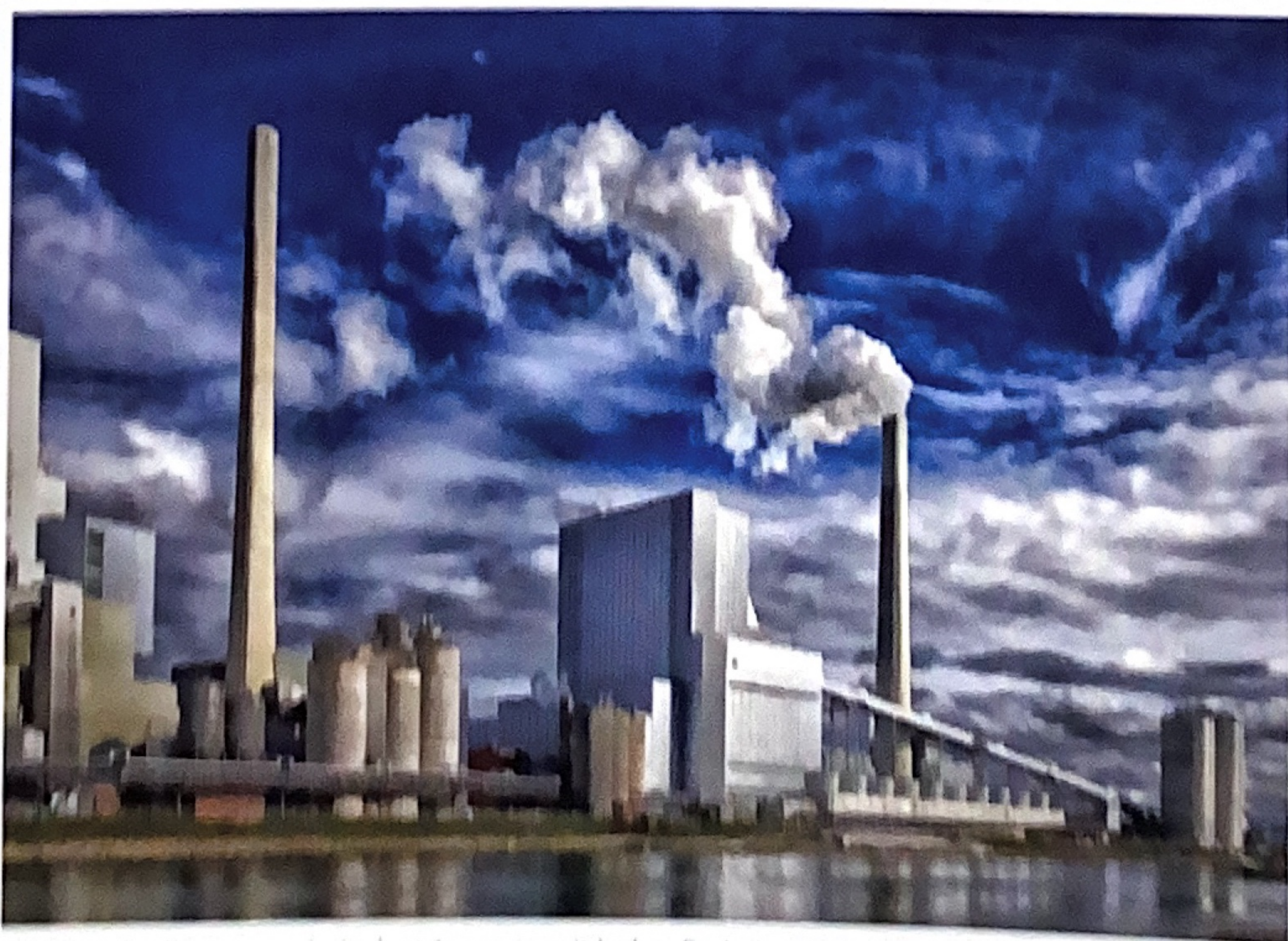
Extreme Bedingungen in Industriezonen mit hoher Emissionsbelastung erfordern für Aluminiumprodukte einen entsprechend hohen Qualitätsstandard.

Die Entwicklung gestaltete sich aufwändig, jedoch überzeugt das Ergebnis. Das Forschungslayout erfolgte in der Qualicoat-Working Group „Pre-Anodizing“, in der auch der VOA durch Fachleute vertreten ist. Diese untersuchte in den Jahren 2018 bis 2020 insgesamt 2622 voranodisierte und chemisch behandelte Proben aus der ganzen Welt, um weitere Erkenntnisse über die Korrosionsbeständigkeit des oberflächenveredelten Aluminiums zu gewinnen und um damit eine sinnvolle Basis für die geplanten Änderungen der Spezifikationen zu generieren.