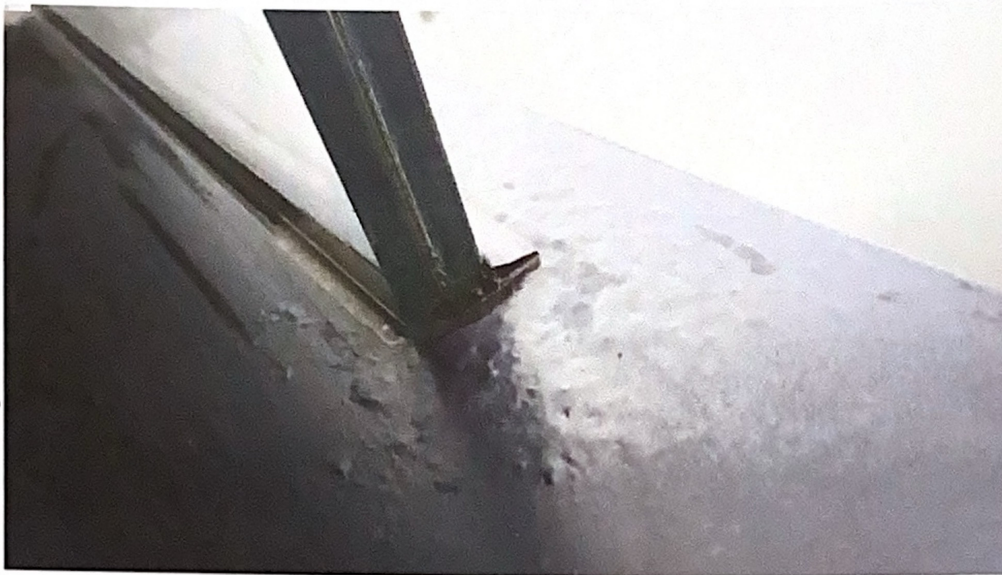
Ziel der Spezifikationen ist es, Fehlerbilder zu vermeiden. Etwa solche Filiformkorrosion an Aluminiumfensterbänken.